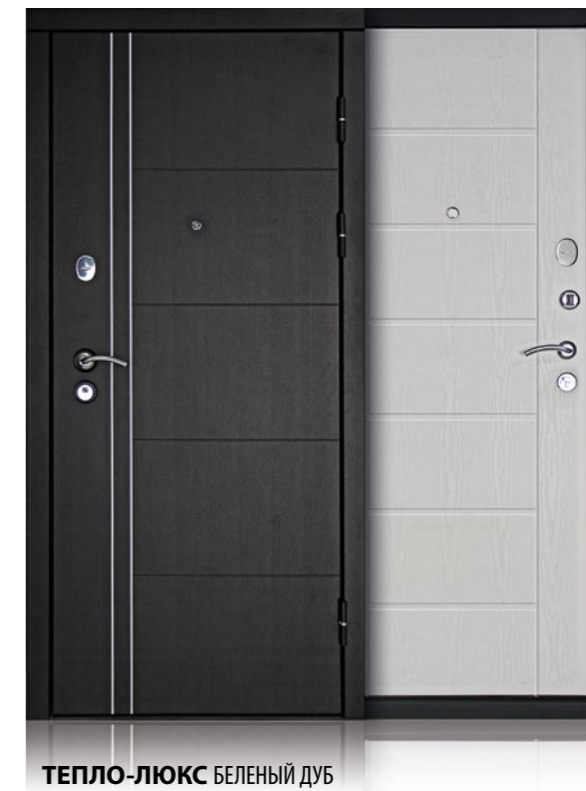
ТЕПЛО-ЛЮКС БЕЛЕННЫЙ ДУБ Внешняя сторона: панель МДФ с молдингами, венге. Внутренняя сторона: панель МДФ, беленый дуб.